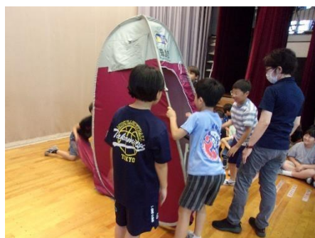
仮設トイレの設置