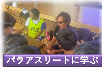
パラアスリートに学ぶ