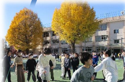
体力向上月間（長縄）