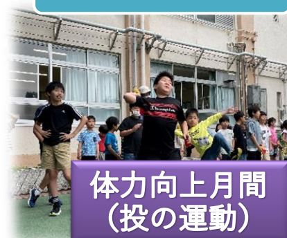
体力向上月間（投の運動）