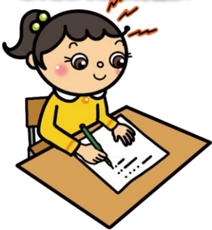
脳を働かせるエネルギー源となり、勉強によく集中できます。