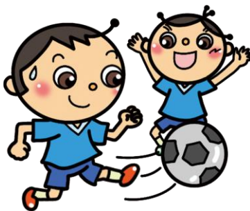
元気に体を動かさせます。集中力も高まり、けがの予防につながります。