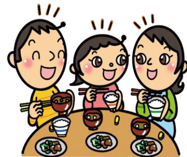
生活リズムが整い、食卓を囲んで1日を明るくスタートできます。