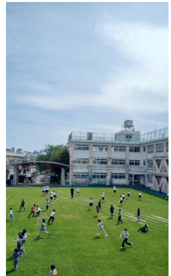
《芝生の校庭で遊ぶ子供たち》

さて、ゴールデンウィークが始まり5連休もあります。学校では、目標や目的をもって有意義に過ごせるよう指導するとともに、安全面での指導も実施しています。また、新学期の疲れがたまっている子もいるかもしれません。お子様の体調管理もよろしくお願いたします。