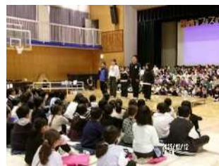
代表委員によるスローガン発表