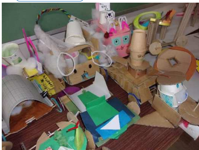
ゴムでゴー！ゴー！ゆめの乗り物