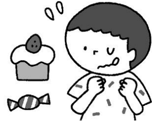
甘いものの食べすぎに注意