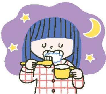
みがくタイミング