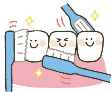
じょうずなみがき方

1本ずつ軽い力で小刻みに。歯と歯肉の境目、歯の裏側、歯と歯の間などを意識しよう。