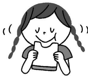
ゆっくりよくかんで食べる